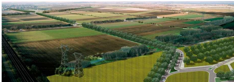
Principes d'espaces verts projetés au sein de la zone